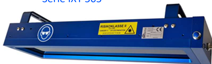
Série IXT 505