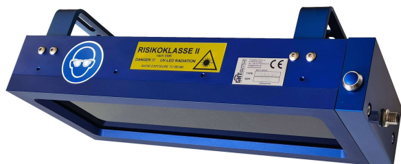
Série IXT 403